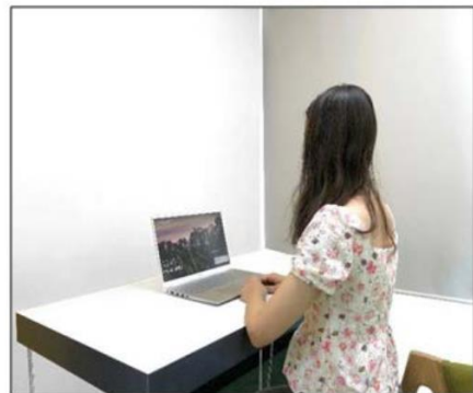
图3：侧后方第二机位效果图